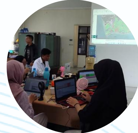
Penguatan Penjaminan Mutu